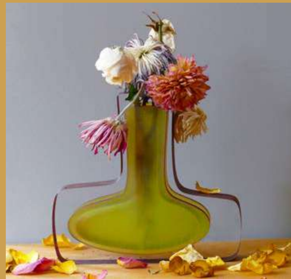
Explosion of spring 2 ©Pedro Almodóvar.

El Festival Perelada ha querido rendir homenaje al autor del cartel de esta edición: Pedro Almodóvar. La muestra está formada por un serie de imágenes que podrían ser sacadas de los interiores de la extensa filmografía del artista. Inspirado por la emoción que irradian los bodegones de realistas madrileños como Antonio López o Isabel Quintanilla, Almodóvar empezó a observar la cotidianidad con otros ojos y a experimentar con el lenguaje fotográfico. Esta muestra se acompaña de objetos vinculados al artista manchego en las vitrinas del museo como libros, carteles de películas, storyboards, guiones... que estarán acompañados de la colección de carteles del festival que se remonta al 1992.